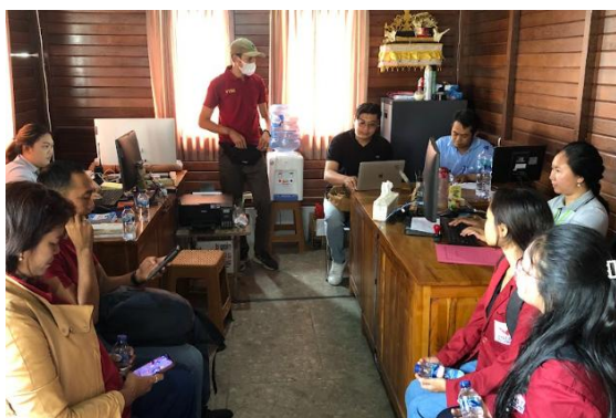
Gambar 4: Pelatihan Web BUMdes

Di era digital, pemasaran tradisional saja tidak cukup untuk menjangkau konsumen secara luas. Ketiadaan strategi pemasaran digital di BUMDes Catu Kwero Sedana Pecatu mengakibatkan berkurangnya visibilitas produk di pasar. Solusi yang diberikan oleh TIM PKM INSTIKI meliputi pengembangan website resmi untuk BUMDes serta pelatihan pemasaran digital kepada staf. Dengan adanya website dan strategi pemasaran yang lebih terstruktur, BUMDes mampu meningkatkan aksesibilitas produk, memperluas jangkauan pasar, serta meningkatkan interaksi dengan konsumen. (Nugrahaningsih et al., 2021)