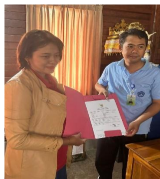
Gambar 1: Penyerahan NIB

NIB merupakan syarat penting untuk menjalankan usaha yang sah dan legal di Indonesia. Tanpa NIB, BUMDes kesulitan mengakses berbagai fasilitas pemerintah seperti kredit usaha, insentif pajak, dan dukungan lainnya. Kolaborasi dengan INSTIKI dimulai dengan membantu proses pengurusan NIB, yang mencakup penyusunan dokumen, pengumpulan data, dan proses pengajuan secara resmi melalui layanan perizinan pemerintah pada link https://perizinan.oss.go.id . Sebelumnya BUMDes sempat mengalami permasalahan karena ada beberapa data dinyatakan tidak valid, namun permasalahan tersebut dapat ditangani melalui chat via whatapp pada layanan OSS. Setelah penerbitan NIB, BUMDes Catu Kwero Sedana Pecatu kini memiliki legalitas yang lebih kuat, memungkinkan BUMDes untuk mengakses berbagai bantuan dan peluang dari pemerintah.(Asnaini et al., 2022)