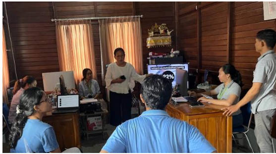
Gambar 3: Pelatihan Perpajakan