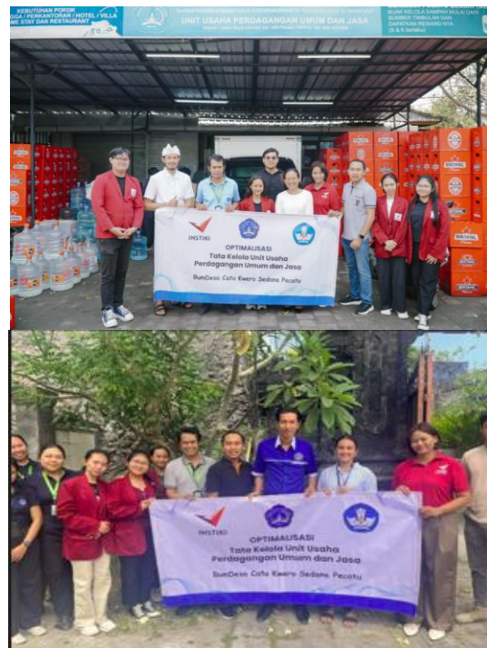
Gambar 5: Foto Bersama Tim Kolaborasi INSTIKI dan BUMDes Catu Kwero Sedana Pecatu

Di akhir penyuluhan, tim memberikan kesempatan kepada peserta untuk memberikan refleksi terhadap proses yang berlangsung, baik saran dan masukan sebagai ukuran evaluasi terhadap pemahaman dan antusiasme dari peserta terhadap kegiatan ini. Hasil evaluasi menunjukkan bahwa peserta telah memiliki pemahaman dan keterampilan yang lebih baik dalam menggunakan sistem informasi akuntansi dan perpajakan serta website. Hal ini sejalan dengan tujuan kegiatan sehingga BUMDes dapat lebih optimal dalam mengelola usahanya untuk memberikan manfaat yang lebih besar bagi masyarakat. (Sri & Dewi, 2014)