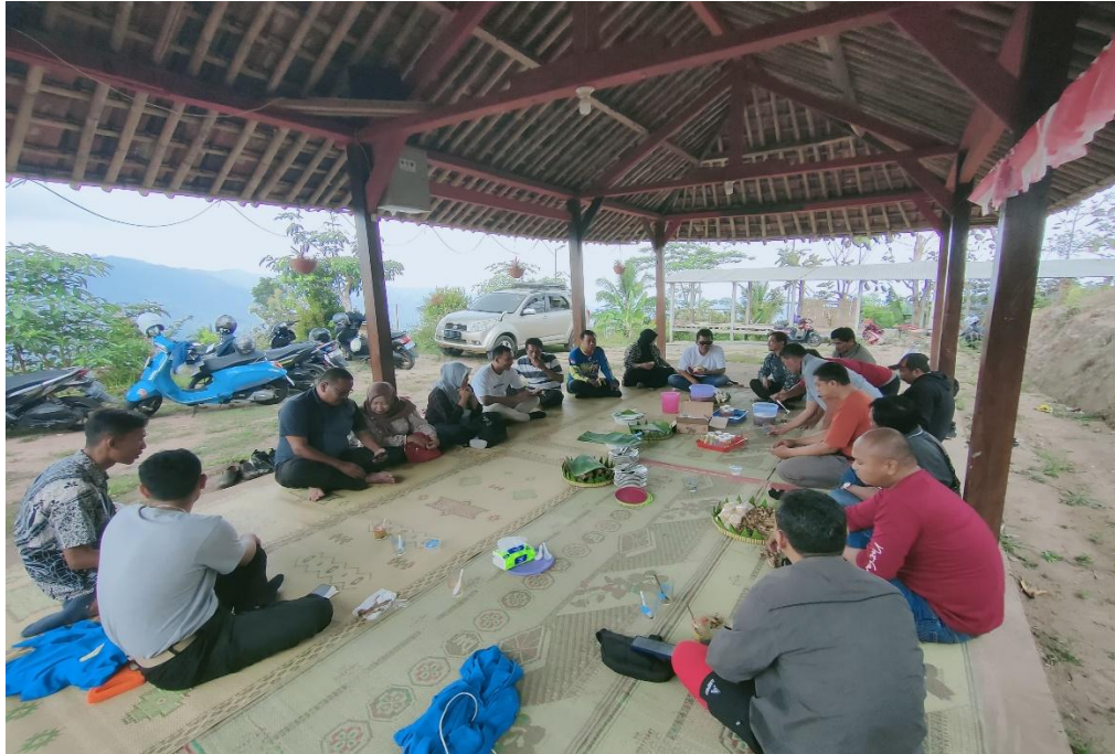
Gambar 5: Sosialisasi Rencana Pembentukan Desa Wisata Banjarsari

menampung sekitar 50 orang sebagaimana terlihat dalam Gambar 5 berikut ini.