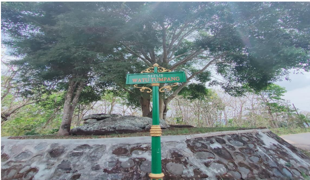
Gambar 4: Watu Tumpang, Lokasi Baritan Masyarakat Banjarsari Samigaluh

Sekedar untuk diketahui bahwa masyarakat sekitar mengadakan Baritan berupa upacara adat yang dilakukan setahun sekali. Baritan merupakan ritual adat masyarakat setempat sebagai wujud syukur atas panen yang mereka dapatkan setahun sekali yang biasanya dilakukan pada bulan Dzulqadha dengan mengambil hari pasaran Jumat Kliwon.