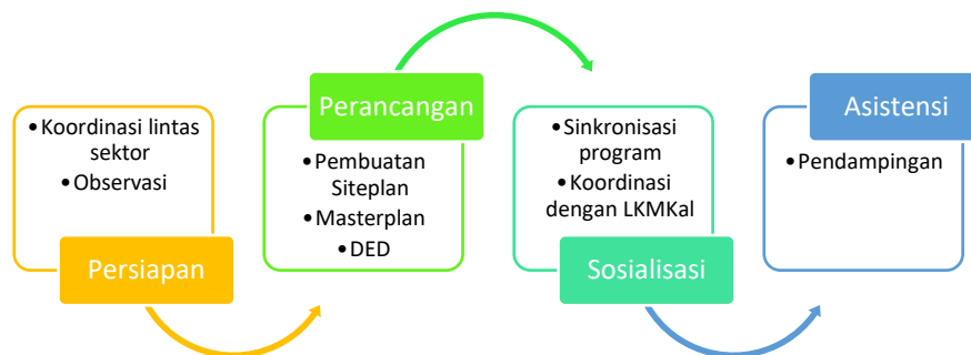
Gambar 3: Tahapan Pendampingan Menuju Desa Wisata Banjarsari

Selanjutnya dalam Pengabdian Kepada Masyarakat tim melakukan 4 (empat) tahap yaitu tahap persiapan, tahap perancangan, tahap sosialisasi dan tahap asistensi.