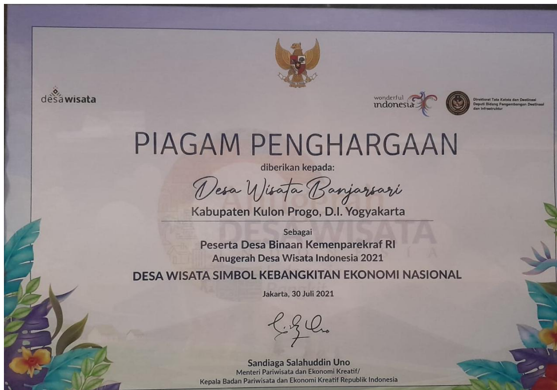
Gambar 1: Piagam Penghargaan Sebagai Desa Wisata

langsung oleh Menteri Pariwisata dan Ekonomi Kreatif, Sandiaga Uno pada tanggal 20 Juli 2021. Namun hingga tahun 2024, Kalurahan Banjarsari belum mampu mewujudkan tantangan tersebut disebabkan oleh keterbatasan sumberdaya yang ada serta keberanian untuk memulai aktifitas kepariwisataan.