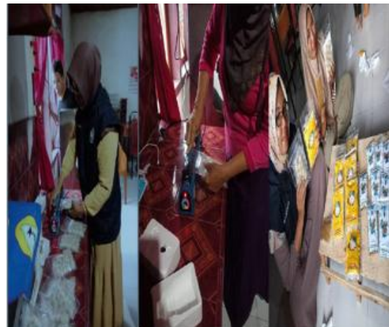
Gambar 5: Proses Pengemasan Produk dan pelabelan produk