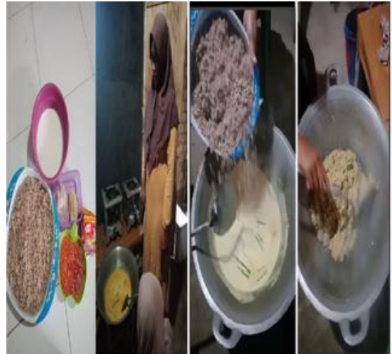
Gambar 8: Proses Pembuatan abon ikan