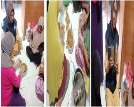
Gambar 11: Proses pengemasan Abon Ikan