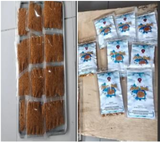
Gambar 12: Abon Ikan yang telah siap di Pasarkan