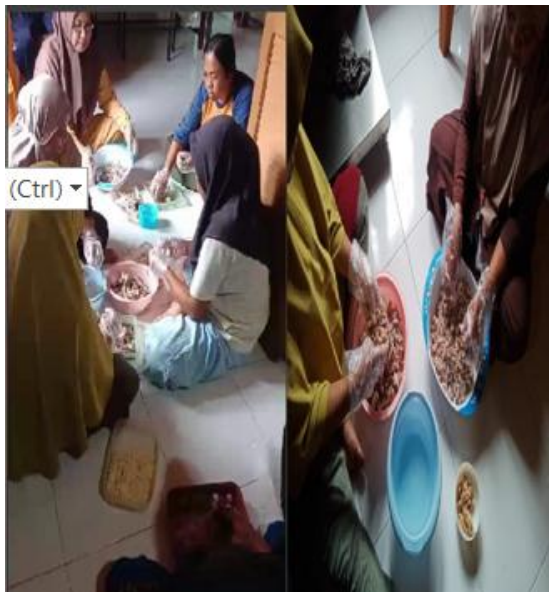
Gambar 7: Proses Pemisahan tulang ikan yang akan dijadikan abon ikan