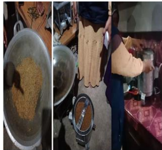
Gambar 9: Proses Pengeringan minyak dengan memakai alat Spiner

Proses pengolahan bahan baku ikan menjadi abon ikan adalah sebagai berikut: