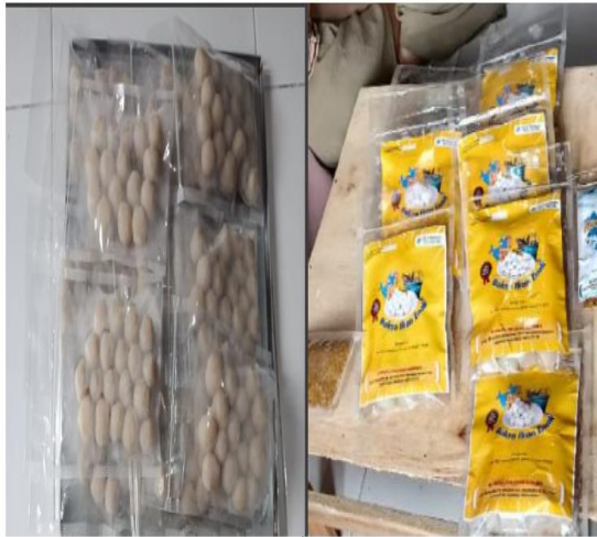
Gambar 6: Produk Bakso Ikan siap dipasarkan