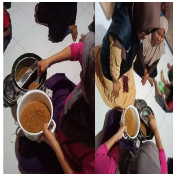
Gambar 10: Abon Ikan yang telah dikeringkan memakai alat peniris minyak (Spiner)