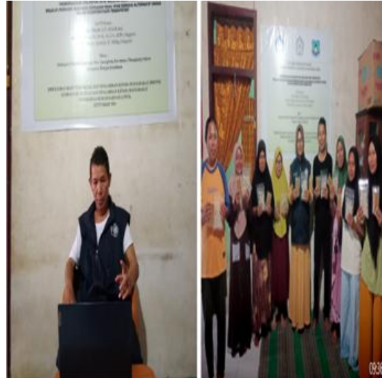
Gambar 13. Pemateri dan Kelompok Poklashar Kadompe