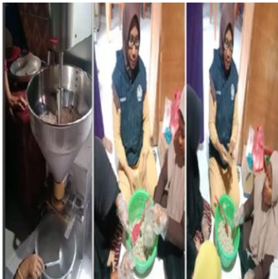
Gambar 4: Proses Pencetakan Bakso Ikan memakai alat pencetak bakso ikan