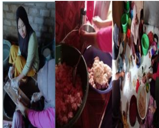
Gambar 3: Proses pemisahan daging ikan dan pencampuran bahan untuk bakso ikan

Proses pengolahan bahan baku ikan menjadi bakso ikan adalah sebagai berikut: