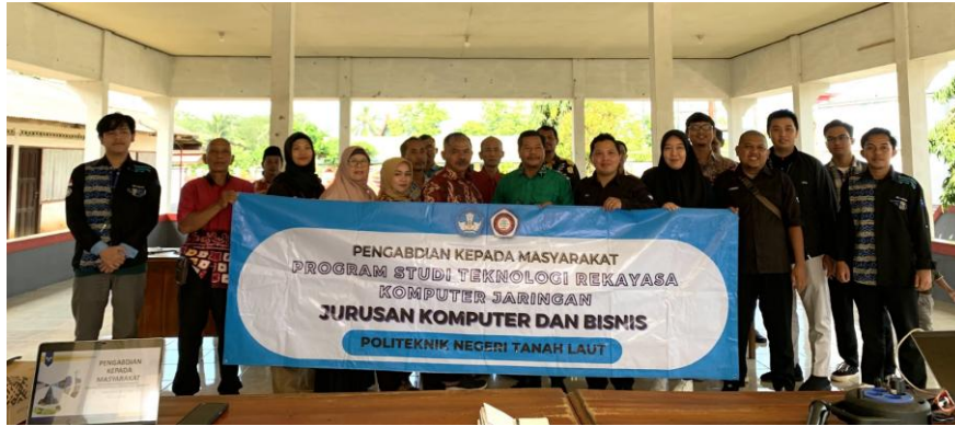
Gambar 6: Sesi Foto Bersama

Acara ditutup dengan sesi foto bersama untuk mendokumentasikan kegiatan ini (Gambar 6). Secara keseluruhan, kegiatan pengabdian ini tidak hanya berhasil memberikan solusi teknis melalui implementasi Queue Tree, tetapi juga meningkatkan kesadaran dan pemahaman aparatur desa tentang