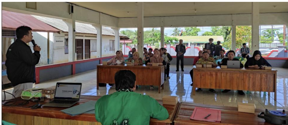
Gambar 3: Penyampaian Materi

aktivitas, sehingga akses untuk aplikasi atau aktivitas yang lebih penting, seperti pelayanan masyarakat, dapat diprioritaskan dibandingkan aktivitas seperti game online. Peserta diberikan pemahaman bahwa dengan pendekatan ini, permasalahan jaringan dapat diselesaikan tanpa harus memblokir akses sepenuhnya.