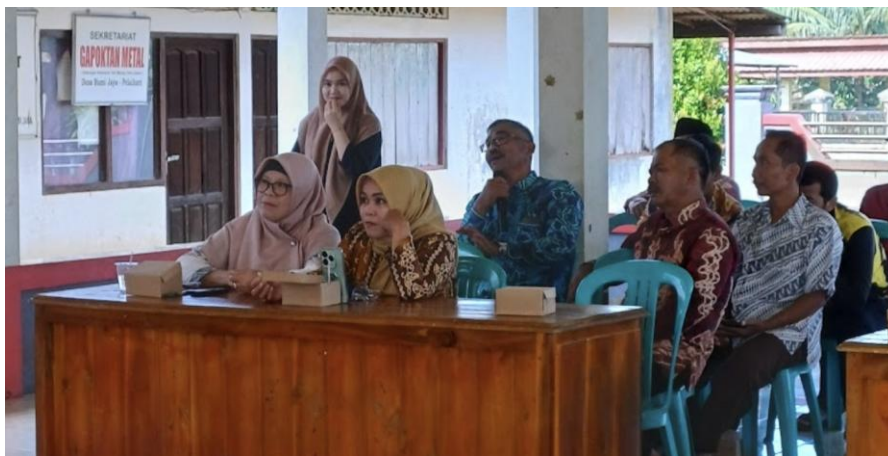
Gambar 5: Sesi Tanya Jawab

Selain itu, kegiatan ini juga memberikan wawasan kepada aparatur desa tentang pentingnya pengelolaan jaringan internet yang tidak hanya berfokus pada penyelesaian masalah teknis, tetapi juga mendukung upaya menciptakan lingkungan kerja yang kondusif. Pengurangan aktivitas bermain game online di lingkungan kantor desa secara langsung memberikan dampak positif, seperti berkurangnya kebisingan dan meningkatnya kenyamanan aparatur desa dalam menjalankan tugas. Efisiensi bandwidth yang lebih baik juga memungkinkan jaringan internet digunakan secara optimal untuk kepentingan administrasi dan pelayanan masyarakat.