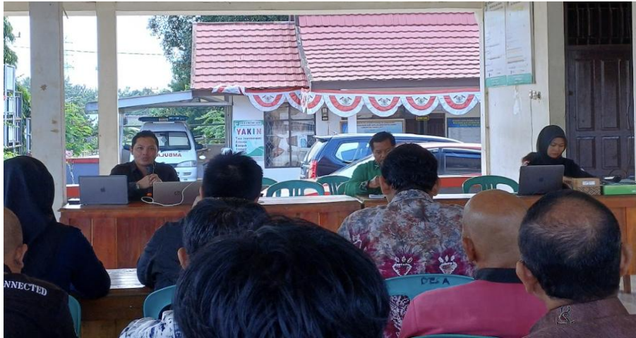
Gambar 2: Sambutan Koordinator Program Studi Teknologi Rekayasa Komputer Jaringan

Setelah sesi pembukaan, tim pengabdian memulai penyampaian materi yang mencakup pengenalan konsep dasar dan manfaat dari fitur Queue Tree (Gambar 3). Peserta diperkenalkan pada prinsip kerja Queue Tree sebagai metode untuk mengelola alokasi bandwidth jaringan. Dijelaskan bahwa teknologi ini memungkinkan pengaturan prioritas penggunaan bandwidth berdasarkan jenis