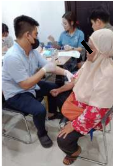
Gambar 2: Pelaksanaan Kegiatan Penapisan Gula Darah