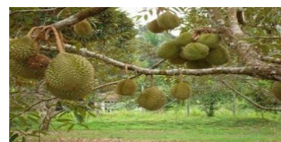
Gambar 1 : Hasil Pertanian Desa Galungan