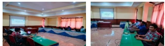
Gambar 6 : Evaluasi Proses Kegiatan