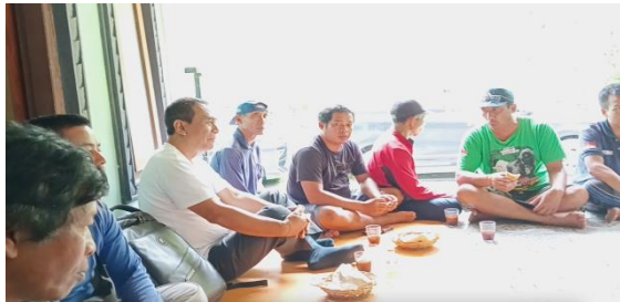
Gambar 5 : Manajemen Usaha KTT Wana Sari Mekar

Pada pendampingan ini kepada Kelompok Tani Ternak (KTT) Wana sari Mekar Desa Gakungan didampingi dalam membuat perencanaan Usaha meliputi b: Perencanaan Penjualan, Perencanaan Produksi, Perencanaan Personalia dan Perencanaan keuangan.