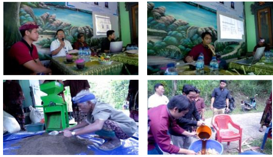
Gambar 4 : Pelatihan Kelompok KTT Wana Sari Mekar