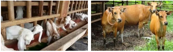
Gambar 2 : Hasil Peternakan Desa Galungan

Masyarakat yang berprofesi sebagai petani dan peternak ini tergabung menjadi Kelompok Tani Ternak (KTT) Wana Sari Mekar. Kelompok Tani Ternak (KTT) Wana Sari Mekar didirikan dan diresmikan pada tanggal 31 Juli 2003 berdasarkan Piagam Pengukuhan Nomor 59/08/VIII/2003 oleh Kepala Desa Galungan dengan jumlah anggota sebanyak 25 orang.