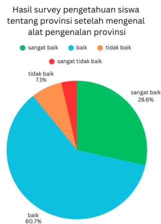
Grafik 2. Hasil survei siswa SDN 1 Sempidi setelah mengenal alat pengenalan provinsi