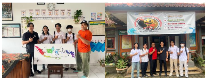
Gambar 8, Gambar 9. Foto bersama tim pelaksana PKM dengan guru dan kepala sekolah SDN 1 Sempidi setelah implementasi dan pelatihan alat pembelajaran interaktif.