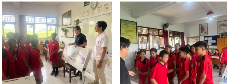
Gambar 4, Gambar 5. Tim PKM mendampingi siswa saat mencoba alat pengenalan provinsi, memperhatikan tingkat pemahaman dan partisipasi aktif siswa.