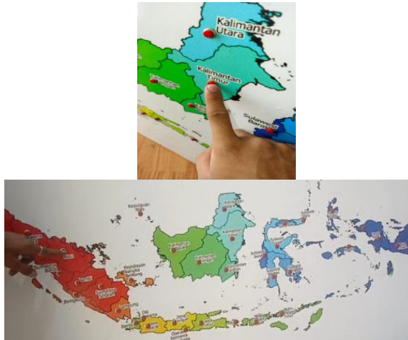
Gambar 3. Siswa kelas 6B SDN 1 Sempidi berinteraksi langsung dengan peta interaktif berbasis mikrokontroler untuk mengidentifikasi letak provinsi-provinsi di Indonesia