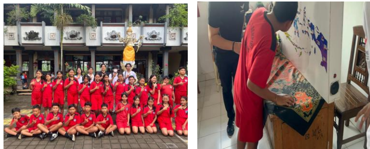
Gambar 6, Gambar 7. Penyerahan modul panduan penggunaan alat oleh tim PKM kepada guru pendamping, sebagai bagian dari strategi keberlanjutan program di sekolah.