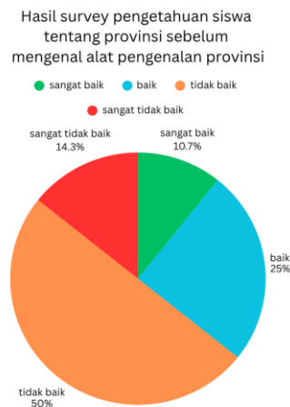
Grafik 1. Hasil survei siswa SDN 1 Sempidi sebelum mengenal alat pengenalan provinsi