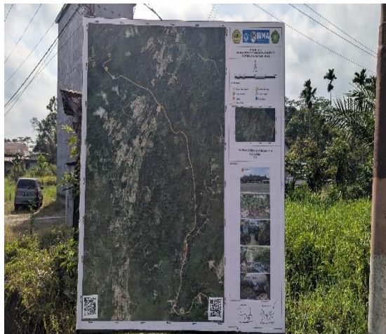
Gambar 1: Peta Lokasi Objek Geowisata

Berikut ini poster/papan informasi yang telah kami buat: