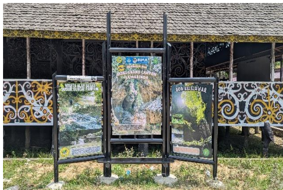
Gambar 4: Fotobooth Objek Geowisata

Oleh karena itu, penempatan papan imbauan di kawasan geowisata yang sebelumnya tidak ada merupakan langkah strategis dalam melestarikan lingkungan, meningkatkan keamanan pengunjung, serta membentuk perilaku wisatawan yang lebih peduli dan bertanggung jawab.