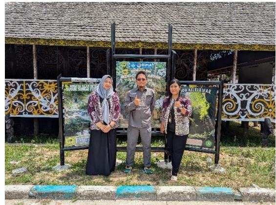
Gambar 5: Tim PKM berfoto dengan latar fotobooth

Kami juga membuat fotobooth berupa objek geowisata yang dimiliki Desa Budaya Pampang sebagai kenang-kenangan para wisatawan yang telah berkunjung ke Desa Budaya Pampang. Pengunjung dapat berpose dengan properti dan latar belakang foto booth yang menampilkan objek geowisata di Pampang.