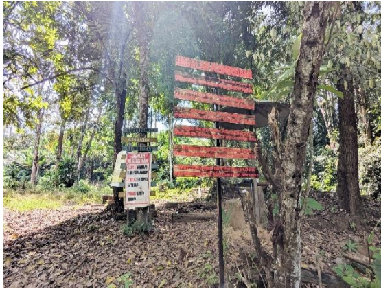
Gambar 3: Papan Imbauan di lokasi Geowisata

Setelah membuat dan memasang peta dan rambu navigasi penunjuk arah, kami juga membuat papan imbauan seperti tampak pada gambar 3.