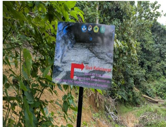
Gambar 2: Rambu Navigasi Arah Lokasi Geowisata

merekomendasikan tempat tersebut kepada orang lain.