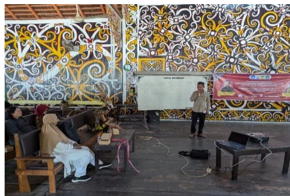
Gambar 6: Pelatihan Pemandu Wisata

Sebelum pelatihan pemandu wisata, kami melakukan evaluasi pra-pelatihan untuk mengidentifikasi keterampilan yang dikuasai saat ini oleh peserta meliputi penguasaan bahasa (baik nasional maupun internasional), tingkat kepercayaan diri dan keterampilan berkomunikasi serta tingkat pengetahuan mereka tentang destinasi, sejarah, budaya, dan pelayanan wisata.