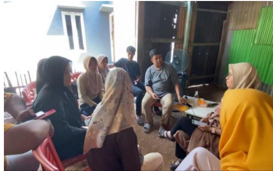
Gambar 6. Pelatihan pembuatan konten dan social media ads

Peserta menunjukkan antusias yang tinggi khususnya pada sesi pelatihan kali ini, hal tersebut dapat dilihat dari mayoritas anggota Pokdarwis memilih untuk fokus pada pelatihan pembuatan konten dan juga pengelolaan social media ads.