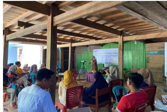
Gambar 3. Pemaparan materi pengenalan konsep Community based tourism

merupakan dosen dari Prodi Kewirausahaan Institut Teknologi dan Bisnis Kalla juga sebagai salah satu tim pengabdian yang memiliki riwayat penelitian dengan tema yang sama terkait Community based tourism .