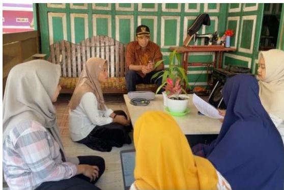
Gambar 2. Observasi Awal Dan Persiapan Pelaksanaan Pengabdian