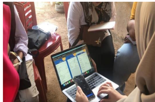
Gambar 7. Pelatihan perencanaan keuangan

Materi terakhir dalam kegiatan pengabdian ini adalah terkait perencanaan keuangan, materi ini dibawakan langsung oleh ibu Khaerunnisa Nur Fatimah Syahnur salah satu dosen dari Prodi Manajemen Retail Institut Teknologi dan Bisnis Kalla yang fokusnya pada bidang Finance dan Accounting. Mengingat kejadian kelam yang dialami oleh beberapa anggota Pokdarwis akibat dari kurangnya literasi finansial, olehnya pelatihan ini dianggap sangat perlu, terlebih bagi para pelaku usaha disekitar desa wisata yang nantinya akan berkontribusi dalam pengembangan desa wisata ini. Pada materi ini para peserta selain diberikan pengetahuan terkait pencatatan keuangan, peserta juga dibekali bagaimana menentukan cost atau penetapan biaya untuk suatu produk dan hal tersebut dianggap sangat relevan khususnya dalam pengembangan produk wisata yang sifatnya sustainable.