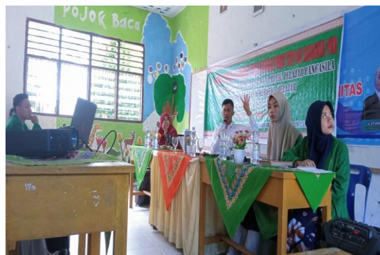
Gambar 1. Pemaparan Materi Implementasi Kurikulum Merdeka

Kegiatan PKM meliputi pengenalan materi pelajaran terlebih dahulu, pelaksanaan sosialisasi kebijakan kurikulum merdeka, nilai atau prinsip kurikulum merdeka, dan sumber media dalam kurikulum merdeka yang disediakan pemerintah yang dapat digunakan untuk memahami kurikulum mandiri, seperti Risalah Kebijakan Dampak Penyederhanaan Kurikulum dan Kemandirian Belajar. Buku Saku Platform. Usai kegiatan sosialisasi, moderator memimpin diskusi antara pemateri dan peserta PKM di ruang tersendiri. Manfaat dari proyek pengabdian masyarakat ini terlihat jelas dalam membantu guru menjadi lebih berpengetahuan dan mahir dalam mengintegrasikan kurikulum merdeka ke dalam pengajaran di kelas.