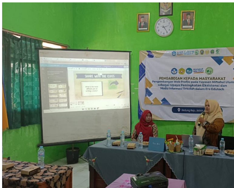
Gambar 5: Pengenalan Media Pembelajaran Kreatif

yayasan, maka diadakan pengenalan media pembelajaran kreatif pembuatan materi ajar yang menarik melalui canva dan pengenalan beberapa game interaktif seperti Marble. Materi canva perlu diberikan agar pengelola website dan akun media sosial dapat membuat berita, pengumuman, serta media promosi dalam bentuk lainnya dengan menarik dan mudah.