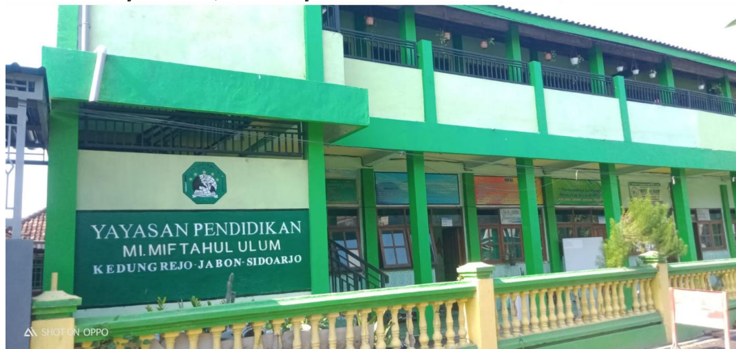
Gambar 1 : Yayasan Miftahul Ulum

Yayasan Miftahul Ulum. Yayasan Miftahul Ulum merupakan yayasan yang bergerak di bidang pendidikan dari tingkat RA, MI, dan MTs yang terletak di Desa Jabon, Sidoarjo. Saat ini jumlah siswa pada masing-masing jenjang di sekolah ini adalah sebanyak untuk tingkat RA sebanyak 17 siswa untuk TK A, 21 orang untuk TK B dan siswa PAUD sebanyak 6 orang dengan 5 orang guru yang bertugas. Pada tingkat MI jumlah siswanya 137 orang dengan jumlah guru sebanyak 15. Pada tingkat MTs, yayasan Miftahul Ulum memiliki jumlah siswa sebanyak 150 dan dengan jumlah guru yang sama dengan MI, yakni 15 orang guru.