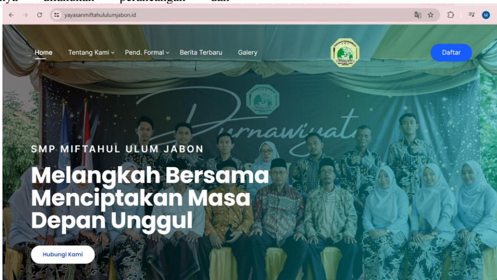
Gambar 3 : Halaman Web Profile Yayasan Miftahul Ulum

Web profile yayasan miftahul ulum dapat diakses pada domain yayasanmiftahululumjabon.id . Adapun partisipasi mitra, dalam hal ini SMP Miftahul Ulum adalah sebagai penyedia informasi yang dibutuhkan dalam pengembangan website sekolah, penyedia tenaga administrator dalam pengelolaan website yayasan nantinya, menyediakan tempat dan SDM yang akan dilatih terkait pengelolaan website dan media pembelajaran kreatif, dan sebagai evaluator keberhasilan web profile yang dikembangkan dalam kaitannya sebagai media promosi dan informasi masyarakat dengan yayasan.