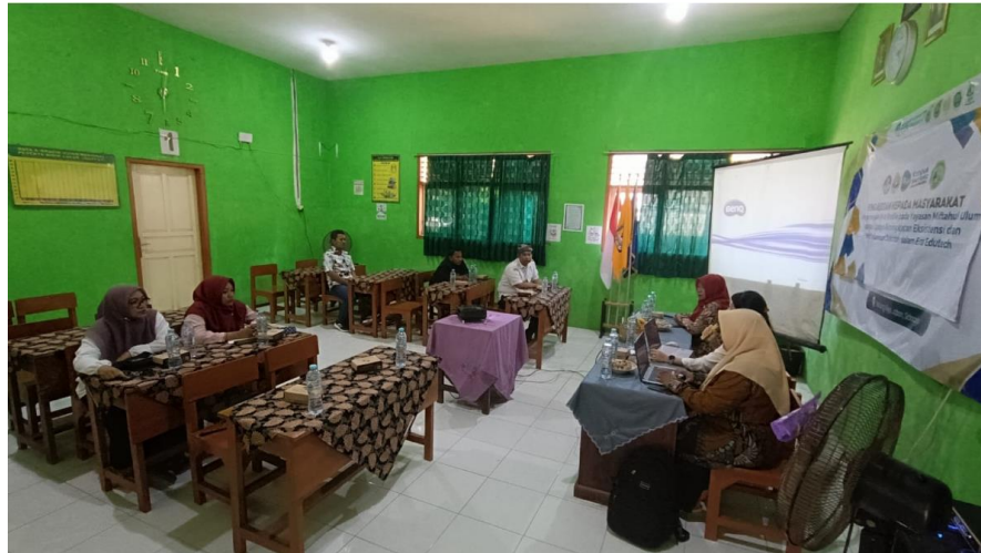
Gambar 4 : Pelatihan dan Pendampingan Web Profile Yayasan Miftahul Ulum

Kegiatan pelatihan melibatkan 7 orang guru SMP Miftahul Ulum, dimana salah 1 dari guru tersebut akan menjadi administrator pengelola konten web profile yang telah dibangun.