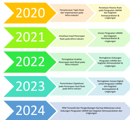
Gambar 3: Roadmap PkM KK BIS

pengelolaan keuangan, seperti terlihat pada gambar 3.