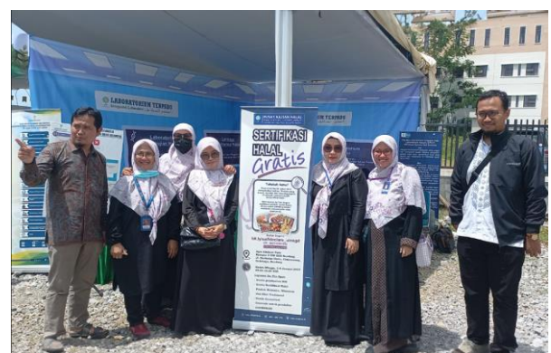
Gambar 2: Aktivitas KHB, Lengkong Kabupaten Bandung