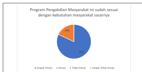
Gambar 4: Umpan Balik Hasil Pengabdian Masyarakat